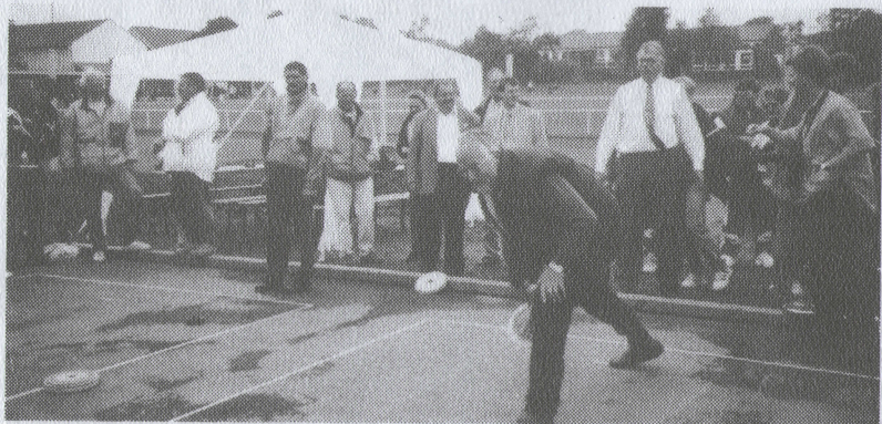
Wohin geht der Schuß des 1. Vorsitzenden?

Es muß eine Flutlichtanlage her! Die nächsten vereinsinternen „Kämpfe“ sind bereits geplant.